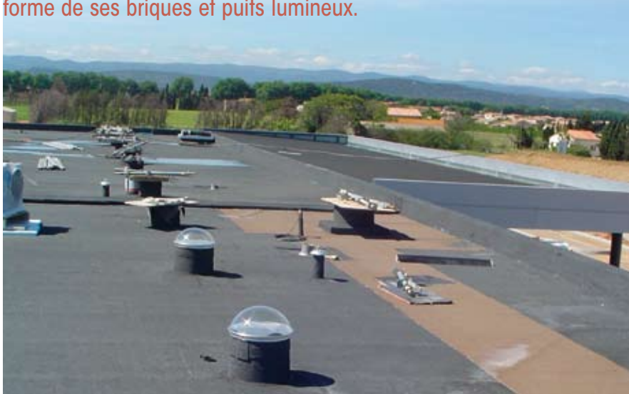
installation par SMAC - Perpignan

Aux Etats Unis, une étude a révélé que la consommation des clients est plus forte dans les magasins éclairés de lumière naturelle. On a constaté en outre que dans les bureaux, l'efficacité et la motivation étaient sensiblement meilleures lorsqu'ils étaient éclairés naturellement. Bref, l'être humain a besoin de lumière naturelle pour son bien-être et sa santé. Mais comment empêcher les surchauffes liées à un excès de vitrage ? Solarwill est convaincu d'avoir une réponse adéquate sous forme de ses briques et puits lumineux.